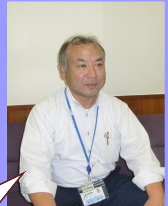
あかぼり支店 桐生支店長

窓口や渉外、時には支店全員でお客様視点の要望やニーズを話し合い、CS活動を通じてお客様の笑顔を大切にできる支店にしていきたい。