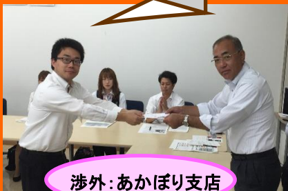
涉外: あかぼり支店