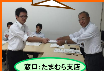
窓口: たまむら支店