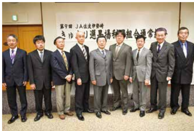
▲きゅうり選果場利用組合