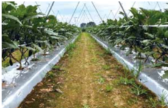
▲露地ナスのV字仕立て

病虫害防除 5月の定植から11月の栽培終了まで約半年と長期となるため、病虫害の防除が必要です。それぞれの特徴を踏まえて管理作業の際に確認すると共に、気象の変化に注意して早期防除に努めます。