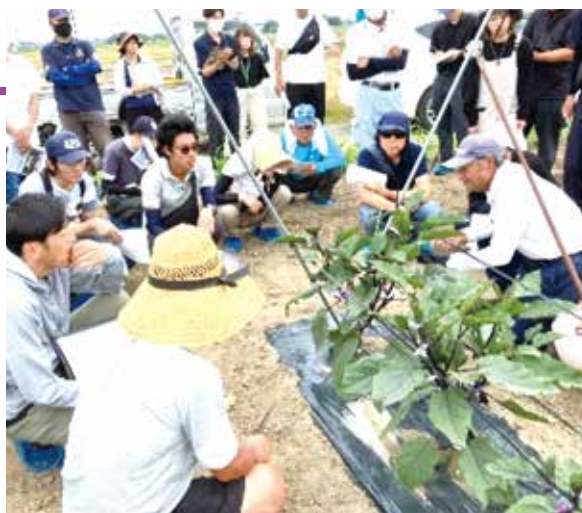
▲先輩ほ場への視察研修

補助事業 生産者の増加や規模拡大を支援するため、県単独の補助事業があります。ナスではV字支柱の導入や施設新設に活用されています(実施には一定の要件があります)。