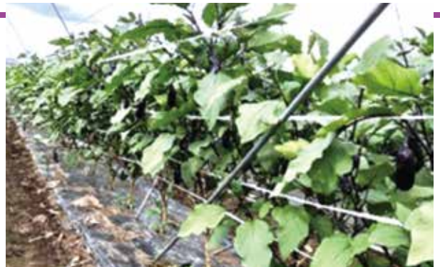
▲収穫期の露地ナス