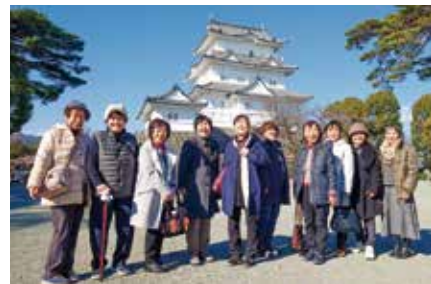
◀小田原城で(玉村地区女性部)

東京都・千葉県・神奈川県など地区ごとに行き先は様々で、観光や買い物などを楽しみました。会員同士の交流も深まり、有意義な研修会となりました。