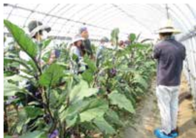
▲半促成ナスの新規講座の様子

発展性がある 栽培技術が熟練してくると雇用を導入した面積拡大や施設を活用した半促成栽培へ発展させることができます。ハウスを活用した施設栽培では保温による早出しや天候に左右されにくい安定した栽培ができるようになります。以前は訪花昆虫がないため交配作業が必須でしたが、近年は単為結果性を持つ品種が開発され、省力化も進んでいます。