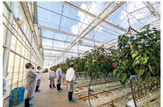
▲アグリステーション誠和で

また、全農ぐんまと農薬メーカーの担当者は、稲を加害するカメムシが畦畔の雑草を經由して水田に侵入するため、除草剤を活用した雑草の防除体系を紹介しました。