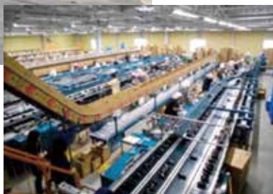
なす・きゅうり 選果場