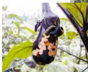
◀オオタバコガによる食害