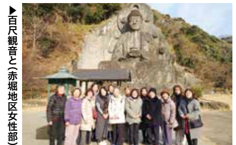
▶百尺観音と(赤堀地区女性部)