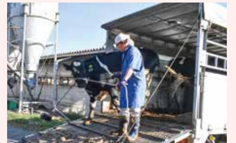
▲JA職員が牛舎まで運搬します